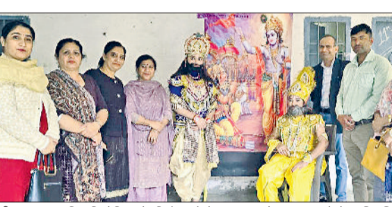
पानीपत। सांस्कृतिक प्रतियोगिता के विजेताओं के साथ आयोजक।