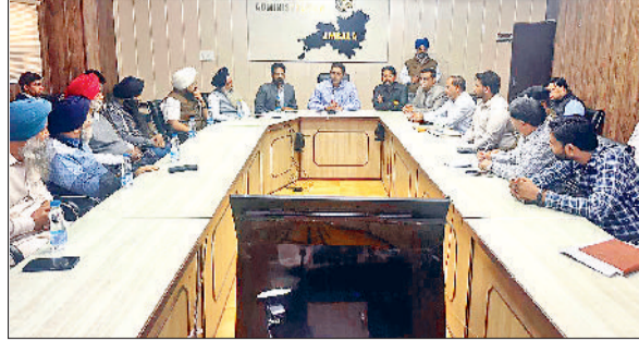
अंबाला। मीटिंग में मौजूद अधिकारी।