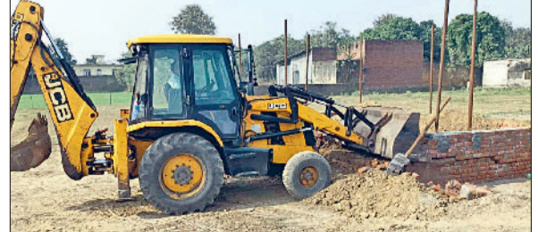
यमुनानगर के व्यासपुर में अवैध कॉलोनी में चलता पीला पंजा।

जिला नगर योजनाकार विभाग द्वारा यमुनानगर जगाधरी के राजस्व संपदा मौजा गुलाब नगर में नियंत्रित क्षेत्र में विकसित की जा रही अनाधिकृत कॉलोनी में किए जा रहे निर्माण कार्य को जेसीबी मशीन से तोड़ दिया। इस दौरान किसी भी अप्रिय घटना से निपटने के लिए मौके पर पुलिस बल तैनात रहा। जिला नगर योजनाकार