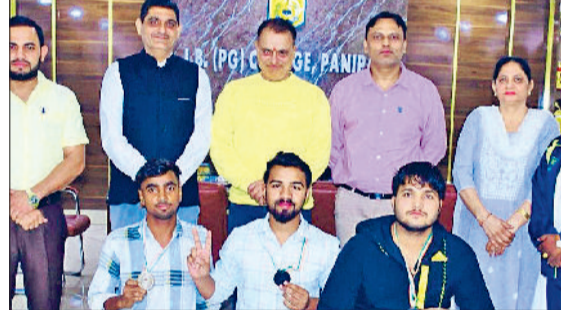
पानीपत। पदक जीतने वाले खिलाड़ियों के साथ स्टाफ सदस्य।