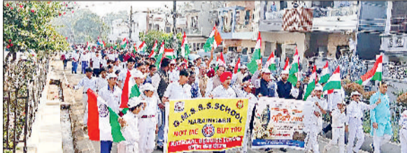
नारायणगढ़। यूनिटी मार्च में हिस्सा लेते युवा व अन्य।