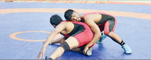
करनाल। दंगल में दम दिखाते पहलवान।