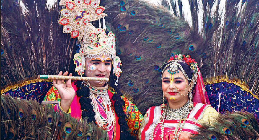
कुरुक्षेत्र। गीता जयंती महोत्सव में अपनी कला का प्रदर्शन करते हुए कलाकार।

ब्रह्मसरोवर के पावन तट पर भारतीय संस्कृति की महक को दूर-दूर तक महसूस किया जा रहा है। इस संस्कृति की महक का एहसास करने के बाद एकाएक देश-विदेश के लोग अंतर्राष्ट्रीय गीता महोत्सव की ओर खिंचे चले आ रहे हैं। इस महोत्सव में जहां शिल्पकार अपनी शिल्पकला से पर्यटकों को मोहित कर रहे हैं, वहीं विभिन्न प्रदेशों के लोक कलाकार पर्यटकों का खूब मनोरंजन कर रहे हैं। अंतर्राष्ट्रीय गीता महोत्सव शिल्प और सरस मेले के 7वें दिन सुबह और शाम के समय दूर-दराज से आने वाले पर्यटकों का विभिन्न प्रदेशों के लोक कलाकार मनोरंजन कर रहे हैं। उत्तरी तट पर जहां राजस्थानी लोक कलाकार कच्ची घोड़ी नृत्य की प्रस्तुति देकर पर्यटकों को नृत्य करने के लिए उत्साहित कर रहे हैं, वहीं उत्तर पश्चिमी तट पर बीन-बांसुरी की धून पर लोक कलाकार भी पर्यटकों को अपनी ओर आकर्षित कर रहे हैं। इस पावन तट के चारों तरफ किसी न किसी प्रदेश के कलाकार, बाजीगर, बहरपिए भी पर्यटकों को लुभा रहे