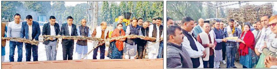
शहजादपुर। पूर्व विधायक तथा एसडीएम गन्ना डालकर पेराई सत्र का शुभारंभ करते व किसानों को सम्मानित करते हुए।