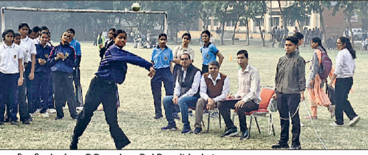
एथलीट मीट के दौरान विभिन्न खेल प्रतियोगिताओं के रोमांचक दृश्य।